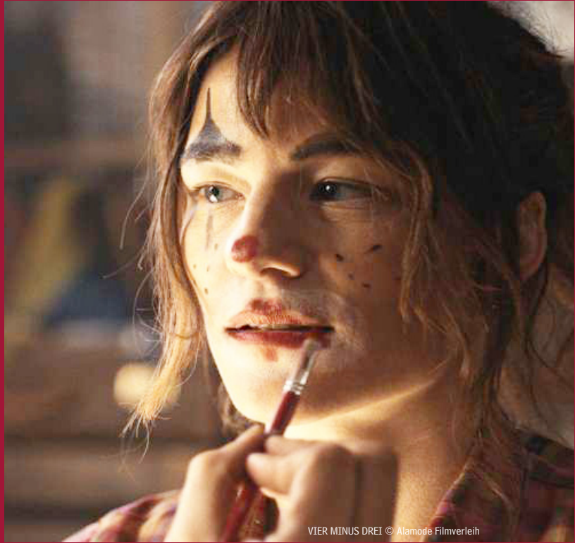
VIER MINUS DREI